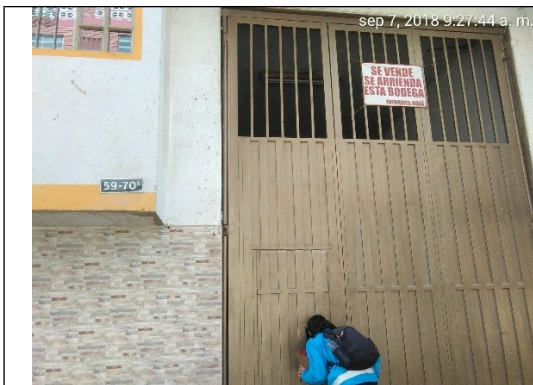
Foto No. 1 Fachada del establecimiento

“(…) EL USUARIO CUENTA CON LA INFRAESTRUCTURA PARA REALIZAR ACTIVIDADES GENERADORAS DE AGUAS RESIDUALES NO DOMÉSTICAS (ArnD) SI NO _____