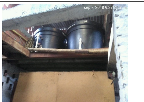
Foto No. 6 Sistema de tratamiento de ARnD.

LA ACTIVIDAD REALIZADA POR EL USUARIO ES GENERADORAS DE ARnD..... SI NO