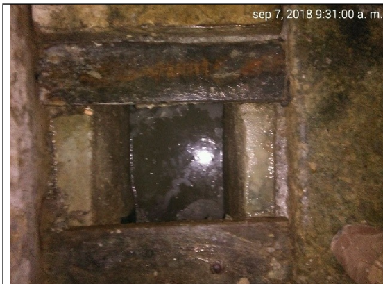
Foto No. 5 Sistema de tratamiento de ARnD.