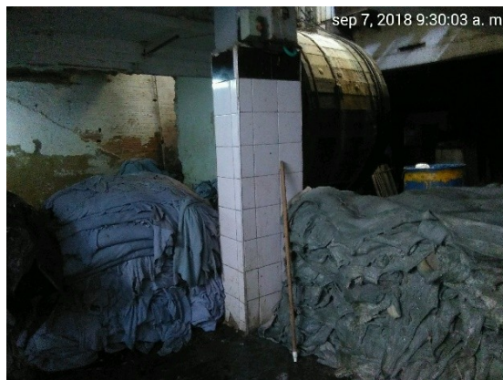
Foto No. 3 y 4 Bombos de proceso húmedo.